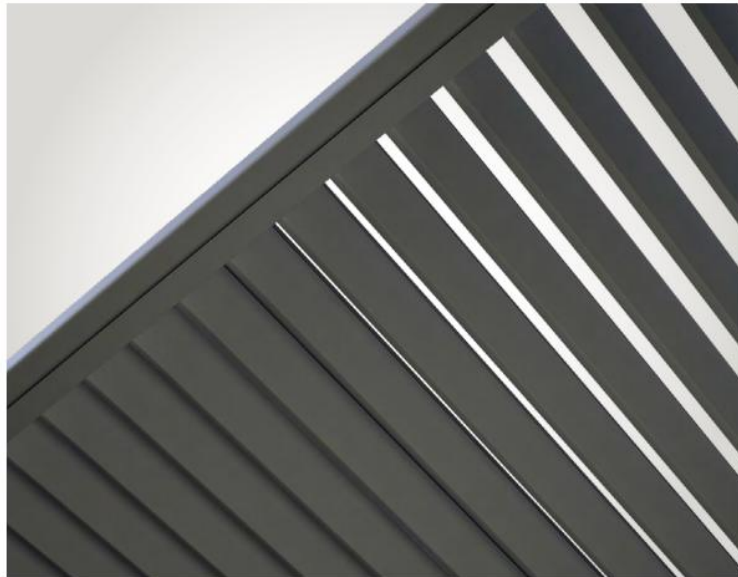
Copertura Climate / Climate covering / Couverture Climate.